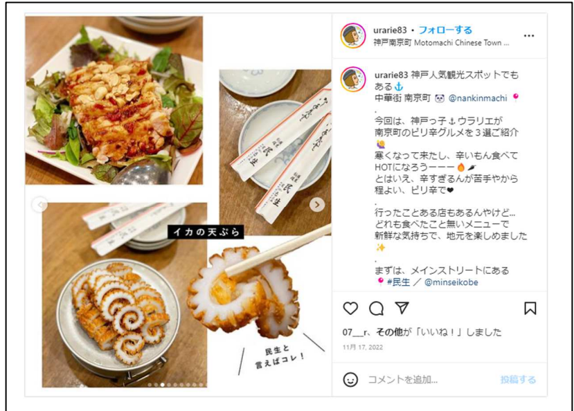
民生のピリ辛メニュー「ヨダレ鶏」と名物「イカの天ぷら」