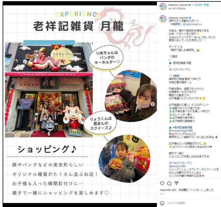
月龍の賑やかで楽しい中国雑貨を親子で堪能

【本件担当】神戸商工会議所 中小企業振興部 藤原・寺坂 TEL : 078-303-5810 FAX : 078-303-6325 神戸市中央区港島中町 6-1