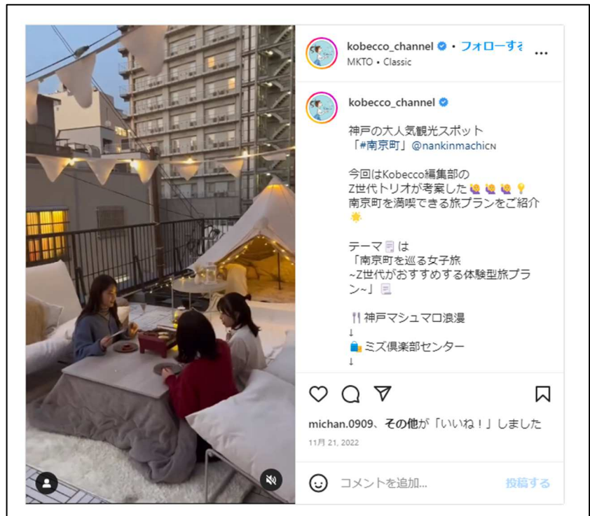
ゲストハウス神戸なでしこ屋での街中屋上グランピング体験