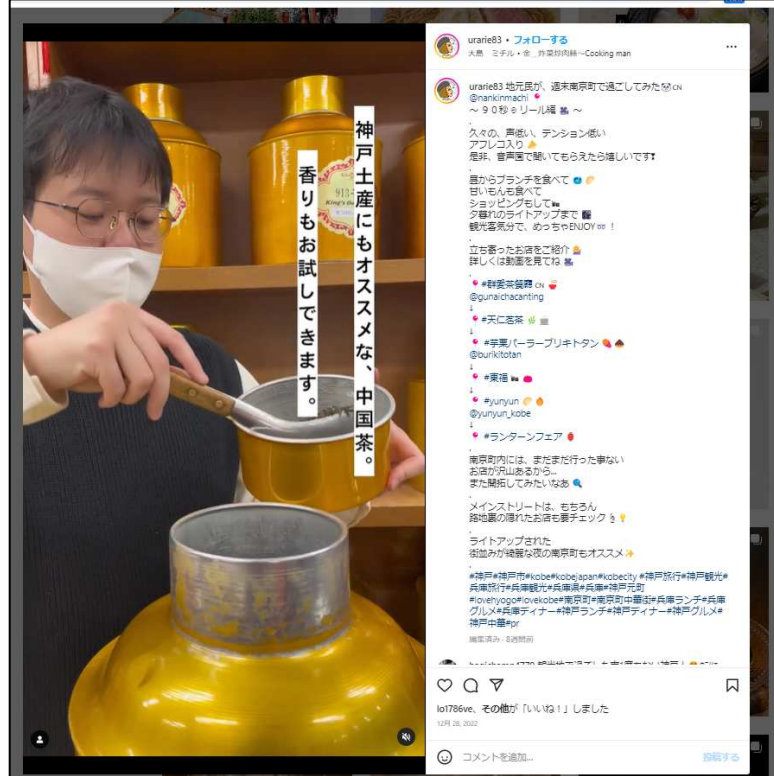
天仁茗茶で茶芸師がお客様に合った厳選された中国茶葉を選定